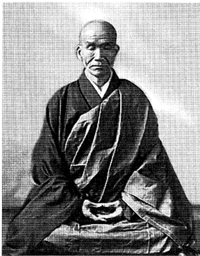
図3 現代の禅僧が修行をしている写真