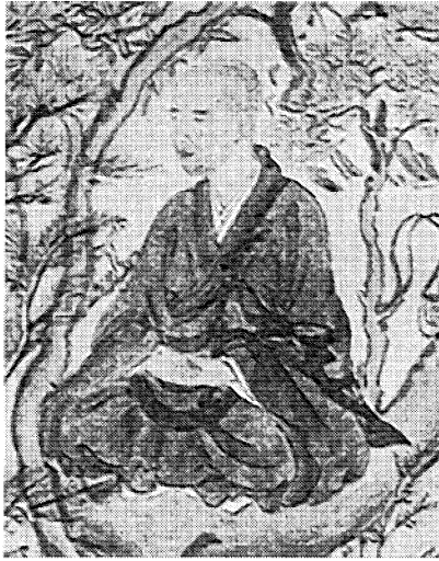
図1 明恵が修行をしている絵

問 3 下線部㉔に関して、次の図1～3は、仏教者の修行の方法について考えるために、授業で先生が示したものである。C、D、先生の三人が、図1～3について交わした次ページの会話中の a ・ b に入る記述の組合せとして最も適当なものを、後の①～⑥のうちから一つ選べ。 11