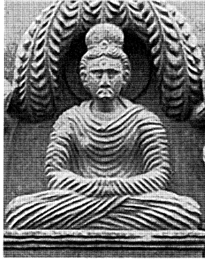
図2 ブッダが修行をしている彫刻